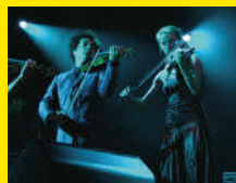
Red Limo String Quartet