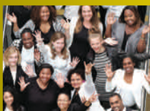
15.05 Wazzup Singers