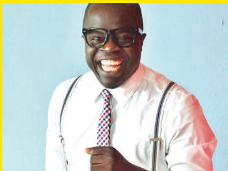
Collin Edson Xperience Stage