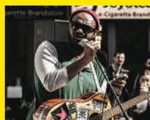
17.30 Rap meets Gospel: Blackrockstar